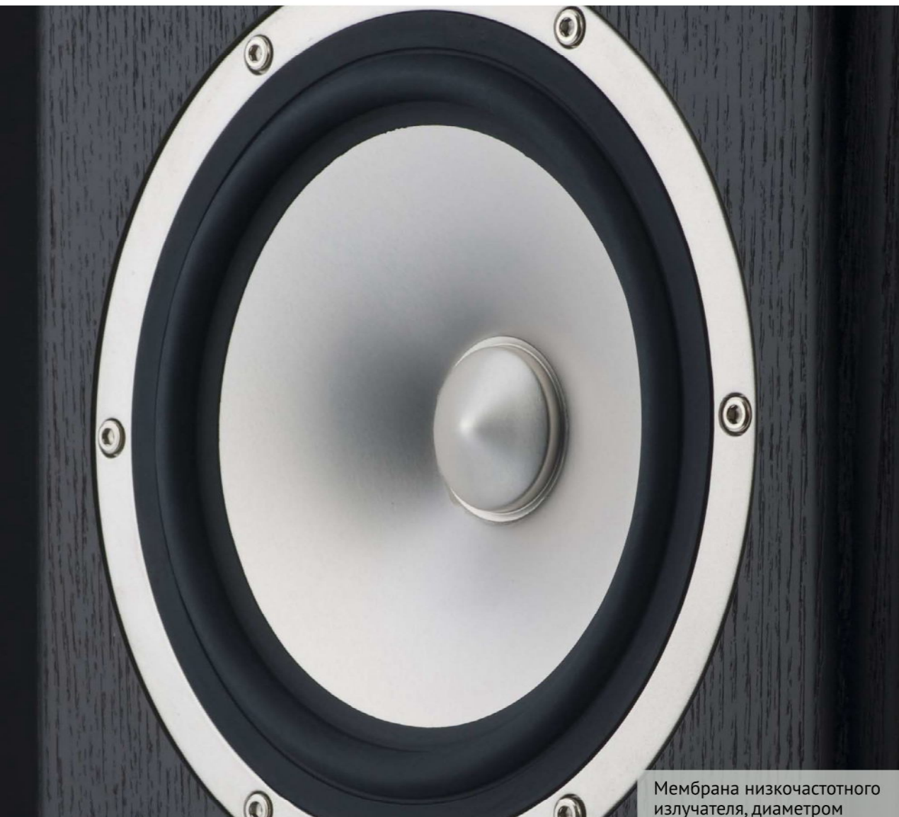
Мембрана низкочастотного излучателя, диаметром 130 мм, изготовлена из прессованного алюминия и установлена в литой металлической корзине.