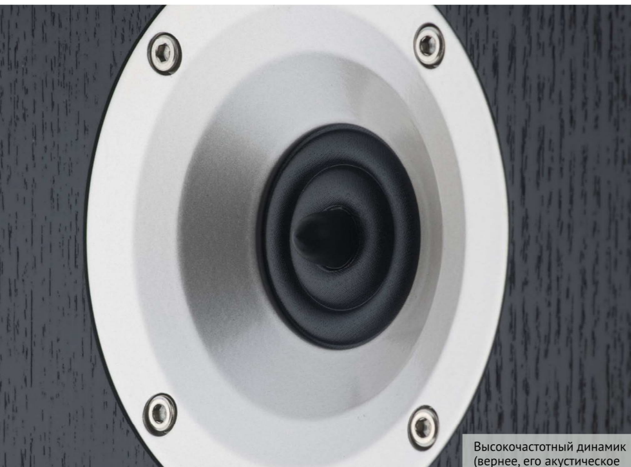
Высокочастотный динамик (вернее, его акустическое оформление) — плод совместных изысканий Acoustic Energy и датской компании DXT.

мерных акустических систем, колонок для мобильных устройств и компьютеров, динамиков, которые могут работать на открытом воздухе в экстремальных погодных условиях, и т.д. Главным же для всех АС от Acoustic Energy , вне зависимости от назначения, является использование технических инноваций, тщательное соблюдение производственного процесса и элегантное дизайнерское решение. И серия Radiance , после 3-летних разработок впервые представленная публике в 2009 году, разумеется, не является исключением.